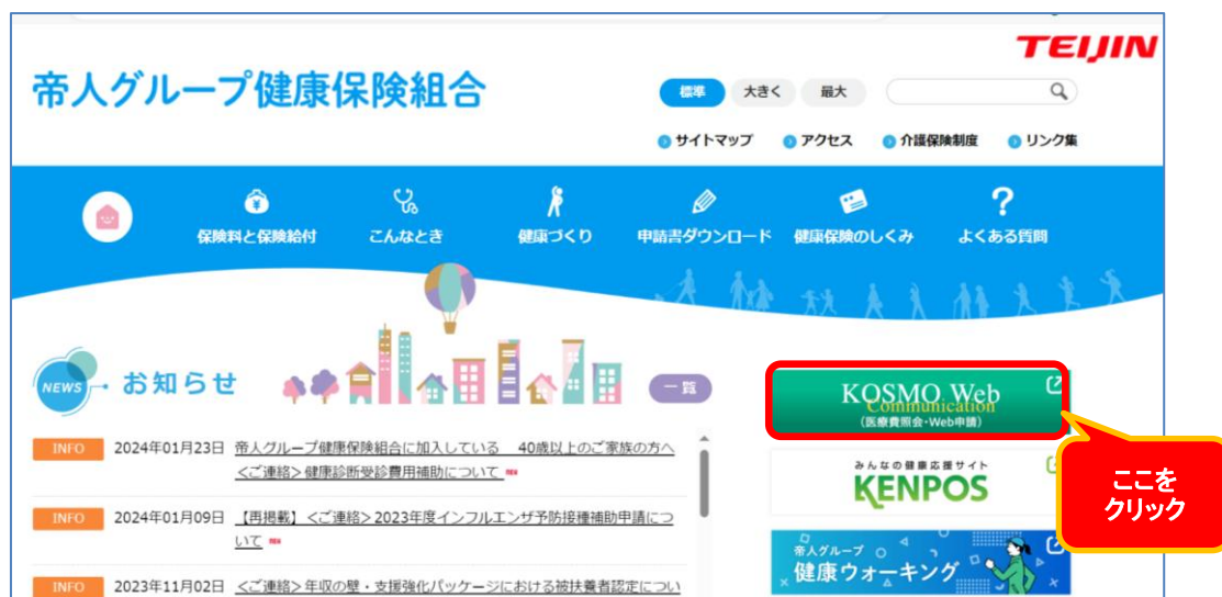
図1 帝人グループ健康保険組合ホームページ

なお、3か月前の受診情報(例: 令和8年2月の照会時には令和7年11月分)までが反映されます。